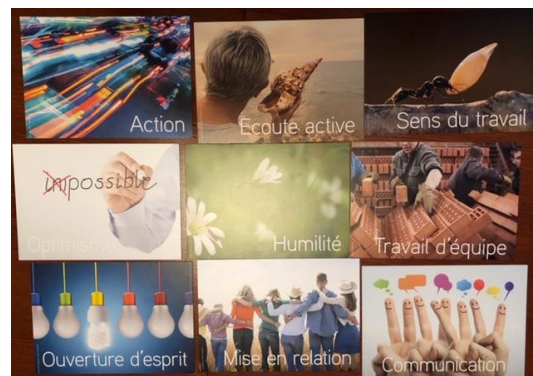
Les forces individuelles identifiées par des membres de l'équipe lors de la démarche de coaching.